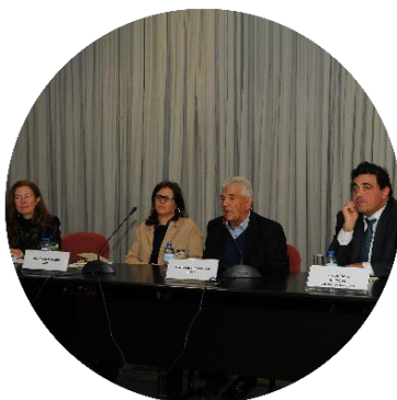
Reunião kick-off: Nov/2017