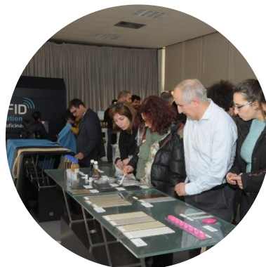
1.ª Reunião Global & Ação de demonstração: Jan/2019