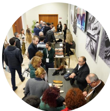
2.ª Reunião Global & Ação de demonstração: Jan/2020